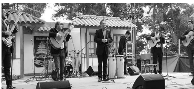
Los Afuerinos en Con Con en Muestra Folclórica de Colmo

Otro de los eventos que se debe mencionar en el accionar del grupo, es el que se realiza en la comuna de Con-Con en la escuela de Puente Colmo, a una muestra folclórica anual que con sus 19 versiones es un evento tradicional en esa comuna con invitados de todo el país, en las cuales el grupo ha participado en 17 de ellas, faltó en la primera ya que se realizó en forma local, más una intermedia en que no se asistió porque el grupo estaba actuando en otra zona.