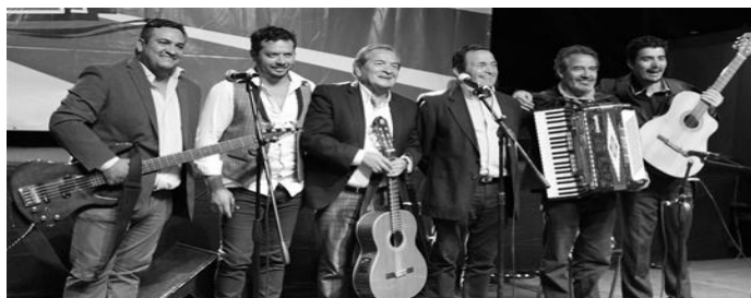
Los Afuerinos en celebración de Roto Chileno en Viña del Mar

Otro de los eventos que realiza el municipio de Viña del Mar es la celebración del “Roto Chileno” en cual el grupo se ha presentado en 5 versiones de las 9 realizadas.