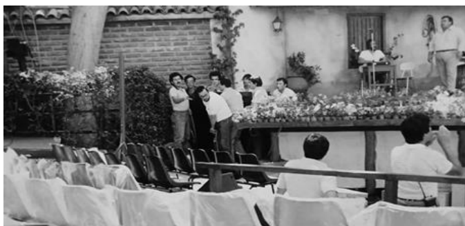
Los Afuerinos intentando de instalar el piano en fosa de la orquesta en el Festival del Huaso de Olmué

Llegamos a Olmué, al Patagual anfiteatro del festival con nuestro cargamento, el piano, por supuesto que los organizadores rechazaron de inmediato, “no, imposible de subir un piano al escenario, como lo subimos y como lo bajamos en pocos segundos entre ustedes y el siguiente interprete y con público de ninguna manera” .