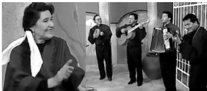
Los Afuerinos en homenaje a Margot Loyola en Canal 4 UCV – 1994