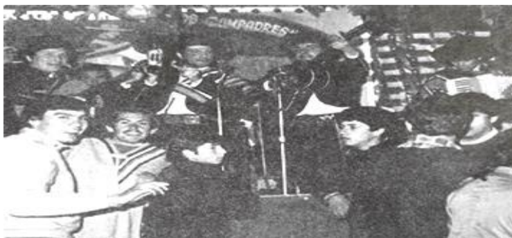
Grupo cuequero Universidad Santa María - 1977