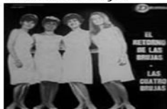
Los cuatro cuarto