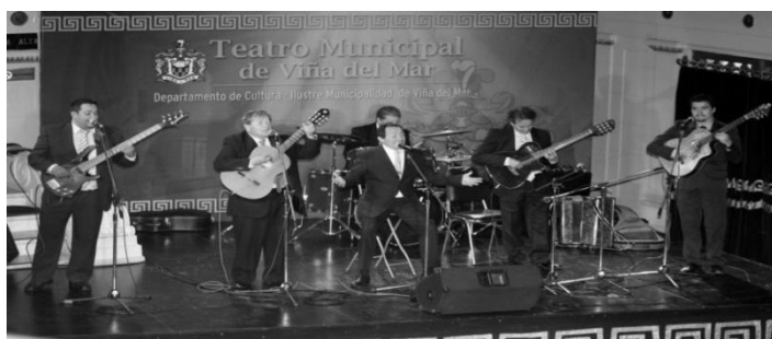
Los Afuerinos en el Teatro Municipal de Viña del Mar “Viña se Viste de Folclor”

Una comuna que siempre nos incorpora en sus actividades es Viña del Mar, tanto en espectáculo en el teatro municipal donde el grupo realizado un sin numero de presentaciones y conciertos, como en otros eventos de caracter folcloricos.