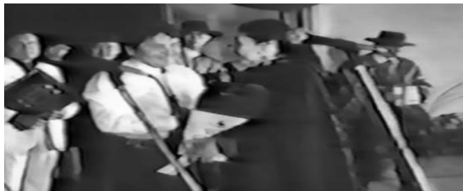
Premiado en Festival de Cueca y Tonada Inédita- Héctor Morales y Margot Loyola

Durante este periodo Los Afuerinos además de la premiación por las composiciones de autorías del grupo, son premiados como Mejores Intérpretes por 4 años consecutivos, lo que significó un tremendo respaldo al trabajo de estudiar y poner la cueca urbana en escenarios de festivales y de público masivo y prácticamente sin ningún otro grupo interpretando este estilo.