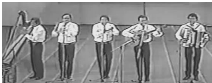
Los Afuerinos en show folclórico del Festival de Viña del Mar presentando "Al Cantor ausente" cueca ganadora Festival del Huaso de Olmué – 1990

De nuevo las asistentes maquillando a pasos de salir al escenario. Termino Europe y por supuesto que el público pidiendo otra y otra, Los Afuerinos al escenario, una rápida ubicación con muy pocas luces termina el anuncio y se encienden las luces con una cantidad gente impresionante y cantar, creo que salimos bien parados, con un aplauso respetable.