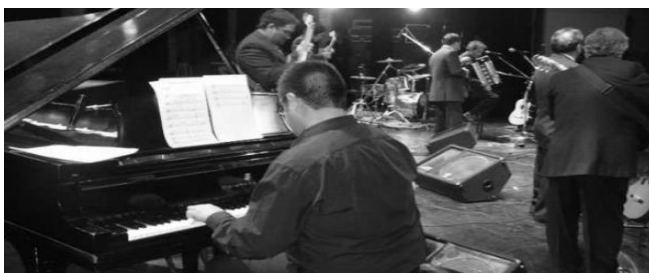
Afuerinos en concierto con Orquesta Sinfónica en Teatro Municipal de Viña del Mar – 2009

Resulto una gran experiencia para el grupo y también para la orquesta ya que para ellos también fue una nueva experiencia de salir de lo clásico y enfrentarse a un repertorio muy distinto a su experiencia. Debemos señalar que también marco un nuevo precedente, el de incorporar las cuecas acompañadas con una orquesta sinfónica en un concierto.