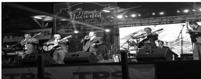
Los Afuerinos en Festival de Cueca y Tonada Inédita de Valparaíso

Otro de los eventos a mencionar es en el 2018 una vez más, la participación en show como estelar en el Festival de Cueca y Tonada Inédita, lo que comprueba la vigencia del grupo que en ese momento contaba con 38 años de trayectoria.