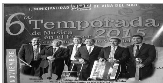
Los Afuerinos en Viña se Viste de Folclor Teatro Municipal Viña del Mar