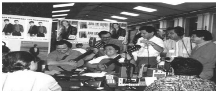
Los Afuerinos en conferencia de prensa en Festival de Viña del

Dentro de las actividades también teníamos conferencias de prensa para los medios escritos y radiales, como anécdota del poco conocimiento que teníamos de los artistas internacionales, estábamos en una conferencia para la radio Portales donde cantábamos la cueca, estábamos en eso cuando el conductor nos dice.