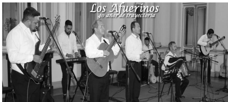
Los Afuerinos en Viña de Mar en "Viña se Viste de Folclor" grabando su última producción.

Esperando que esta no sea la última presentación y que la humanidad tenga una pronta sanación y recuperación y nos permita continuar de disfrutar y compartir esta pasión de más 40 años en el cantar en nuestro país.