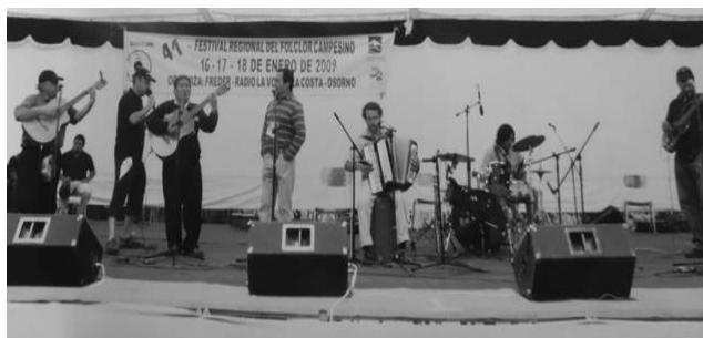
Los Afuerinos prueba de sonido en Osorno — 2009

En este periodo las actuaciones en país se reiteraban para el grupo, en presentaciones en distintos espectáculos, podemos mencionar en 2009 en Osorno en el Festival de esa ciudad.