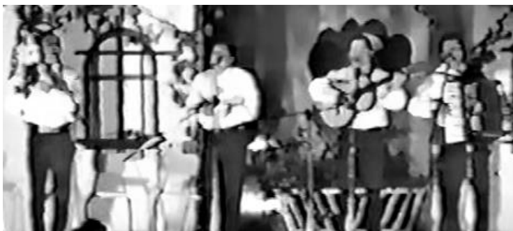
Los Afuerinos Ganadores 1º lugar Festival Nacional de la Cueca en Santa Cruz