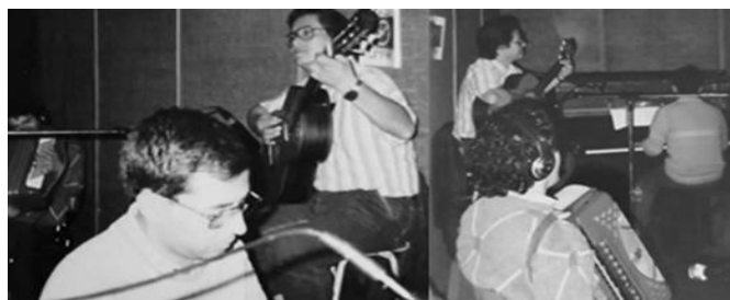
Los Afuerinos en sesión de grabación